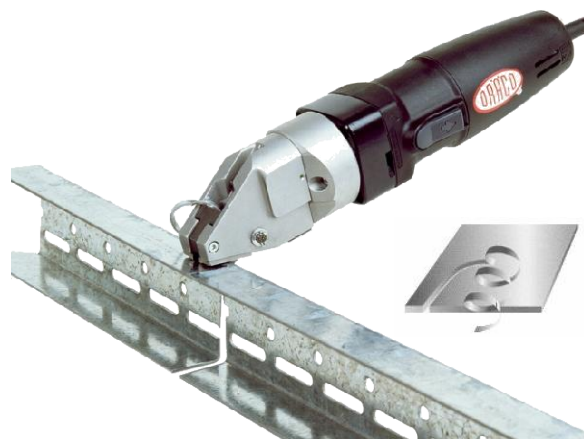
Afbouw: Metal stud profielen/UA-profielen